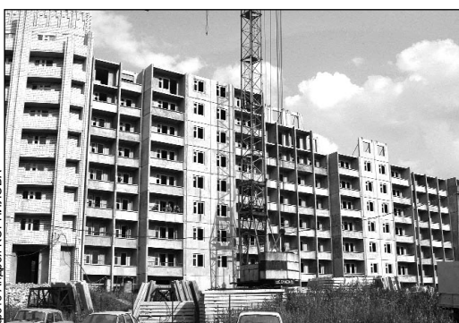
Ежегодно в области скупают 300 тысяч квадратных метров жилья

Снижения цены квартир в новостройках можно добиться за счет удешевления стоимости инженерных сетей.