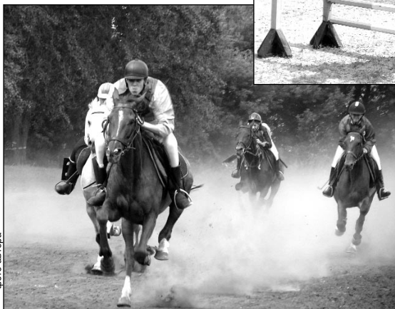
На ипподроме установили пять рекордов