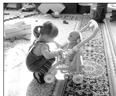
Сейчас детские сады переполнены

Специально созданная рабочая комиссия займется не только изуче-