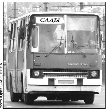
Сорок лет школьники ездили бесплатно, а сейчас – за 7 рублей

Но самое удивительное, что ни городские, ни областные чиновники, ни само руководство ОАО ПАТП Курска, к которому относится маршрут, ничего не знают о новшестве. В ПАТП признали, что маршрут всегда был городским и на нем ездило много школьников. Не ответив ничего вразумительного по поводу постановления, нас переадресовали в областную комиссию транспорта. Дес-