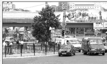
Уехать от Центрального рынка станет проще?