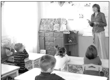
Лучшие педагоги воспитали много победителей олимпиад

Столько скачек, бегов и выступлений конюшников, как в минувшие выходные, курский ипподром не видел с середины 70-х годов прошлого века. Там прошли первые открытые конноспортивные соревнования, посвященные победе в Курской битве на призы губернатора.