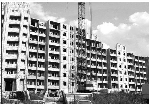
Ежегодно в области скупают 300 тысяч квадратных метров жилья

Снижения цены квартир в новостройках можно добиться за счет удешевления стоимости инженерных сетей.